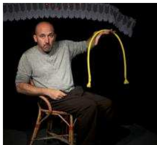
La rue est à vous !