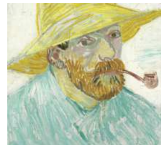
Van Gogh, le Hollandais halluciné