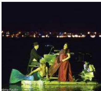
Un piano à la mer !

Accueil Editorial Agenda Espace Pro Abonnement Le kiosque A propos Contacts