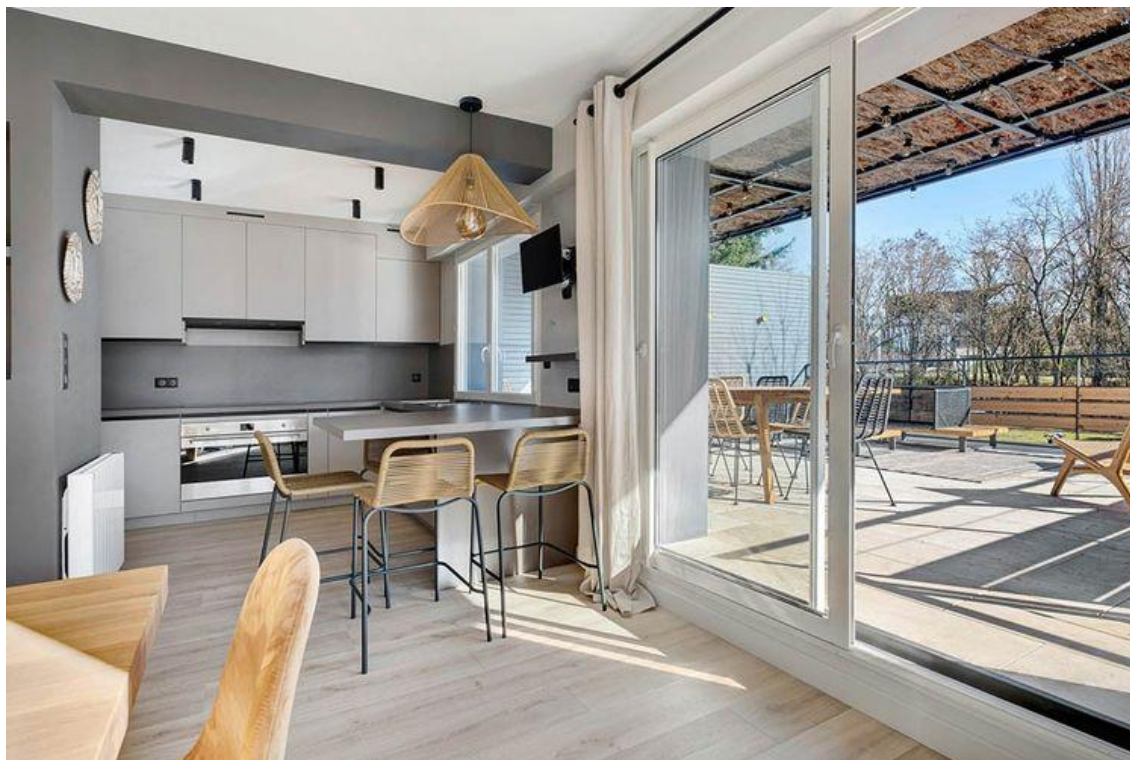
La cuisine équipée propose une ouverture sur la terrasse.